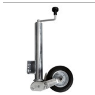
Automatik-Stützrad automatic jockey wheel