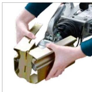
Safety Box XL anti theft protection