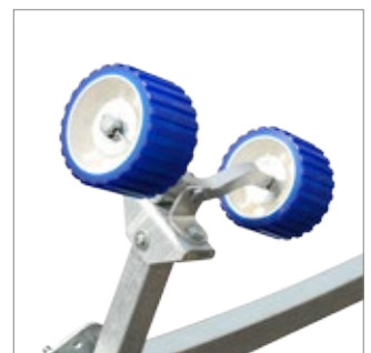
Pendelrolle mit Halter slip roller with holder